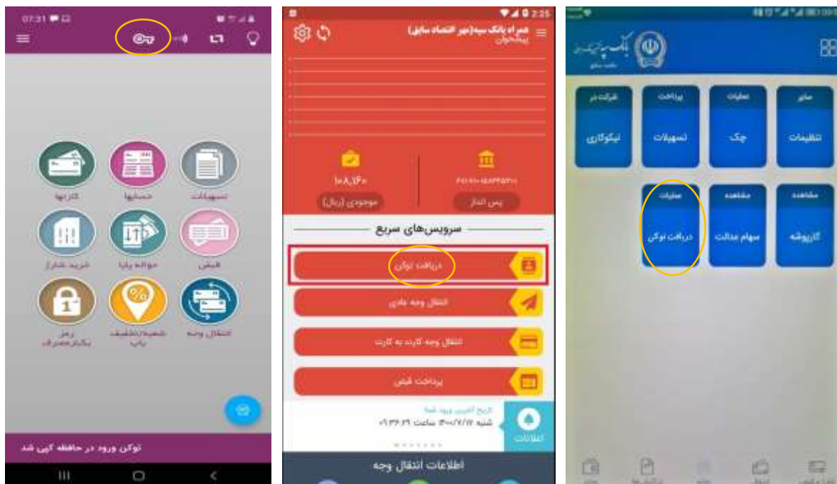
شکل ۱۴ (گزینه دریافت توکن در همراه بانک حکمت، مهر اقتصاد، کوثر)